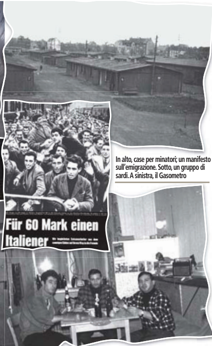
In alto, case per minatori; un manifesto sull'emigrazione. Sotto, un gruppo di sardi. A sinistra, il Gasometro

L'unico progetto italiano è inserito nelle iniziative del gemellaggio con Carbonia